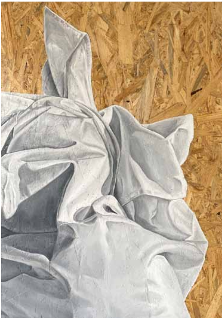
Cocoon II, 2022, huile sur panneau OSB, 70 x 50 cm