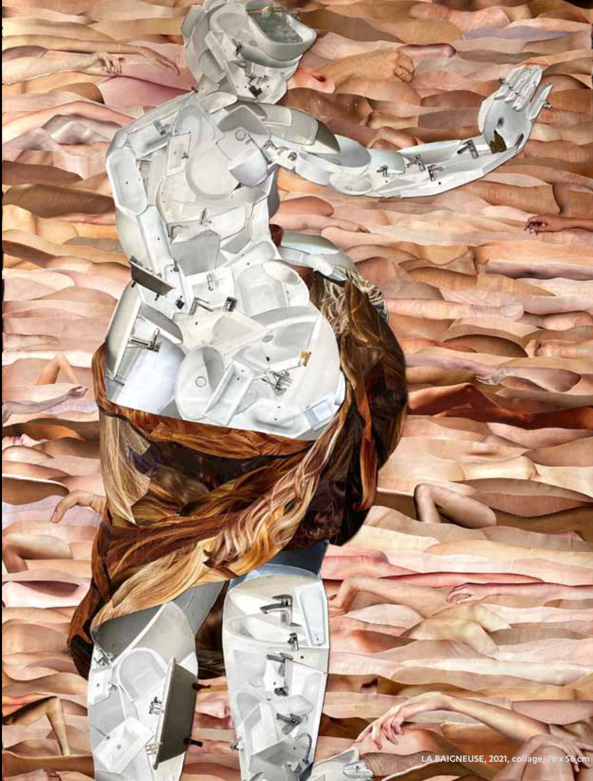
LA BAIGNEUSE, 2021, collage, 76 x 56 cm