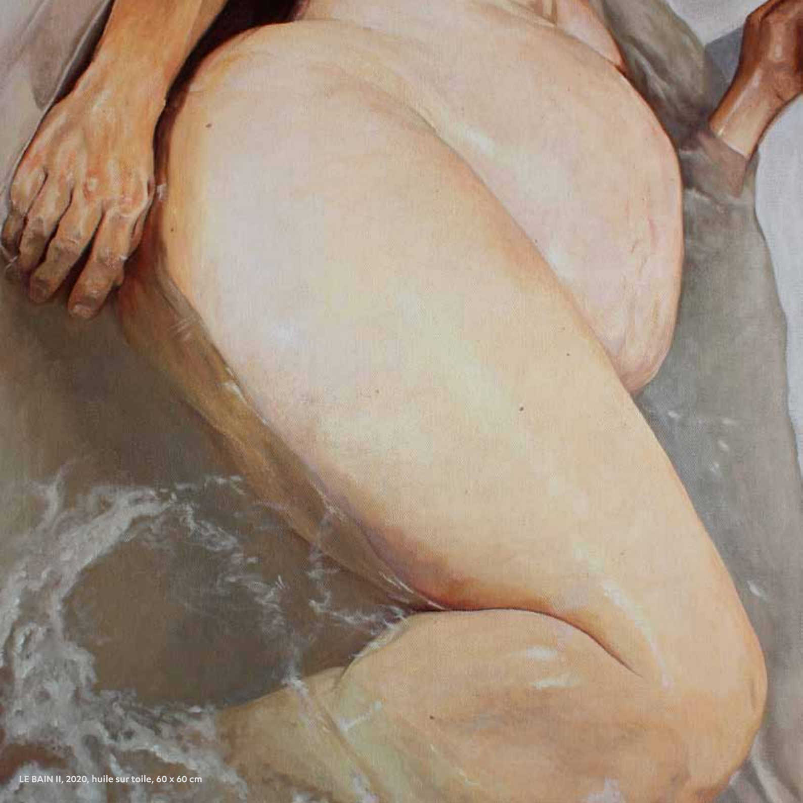
LE BAIN II, 2020, huile sur toile, 60 x 60 cm