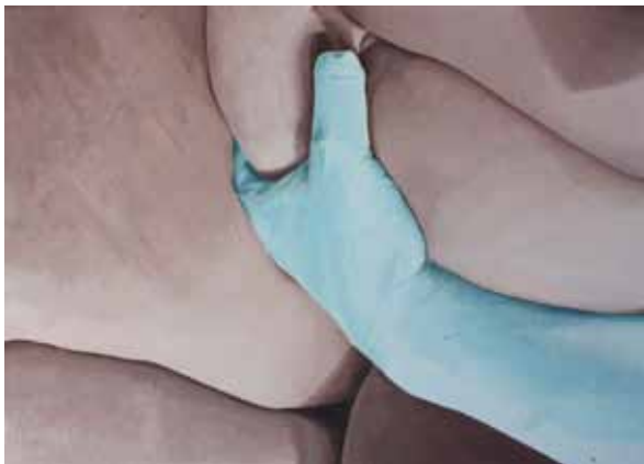
CONTRESENS I, 2016, huile sur toile, 50 x 70 cm