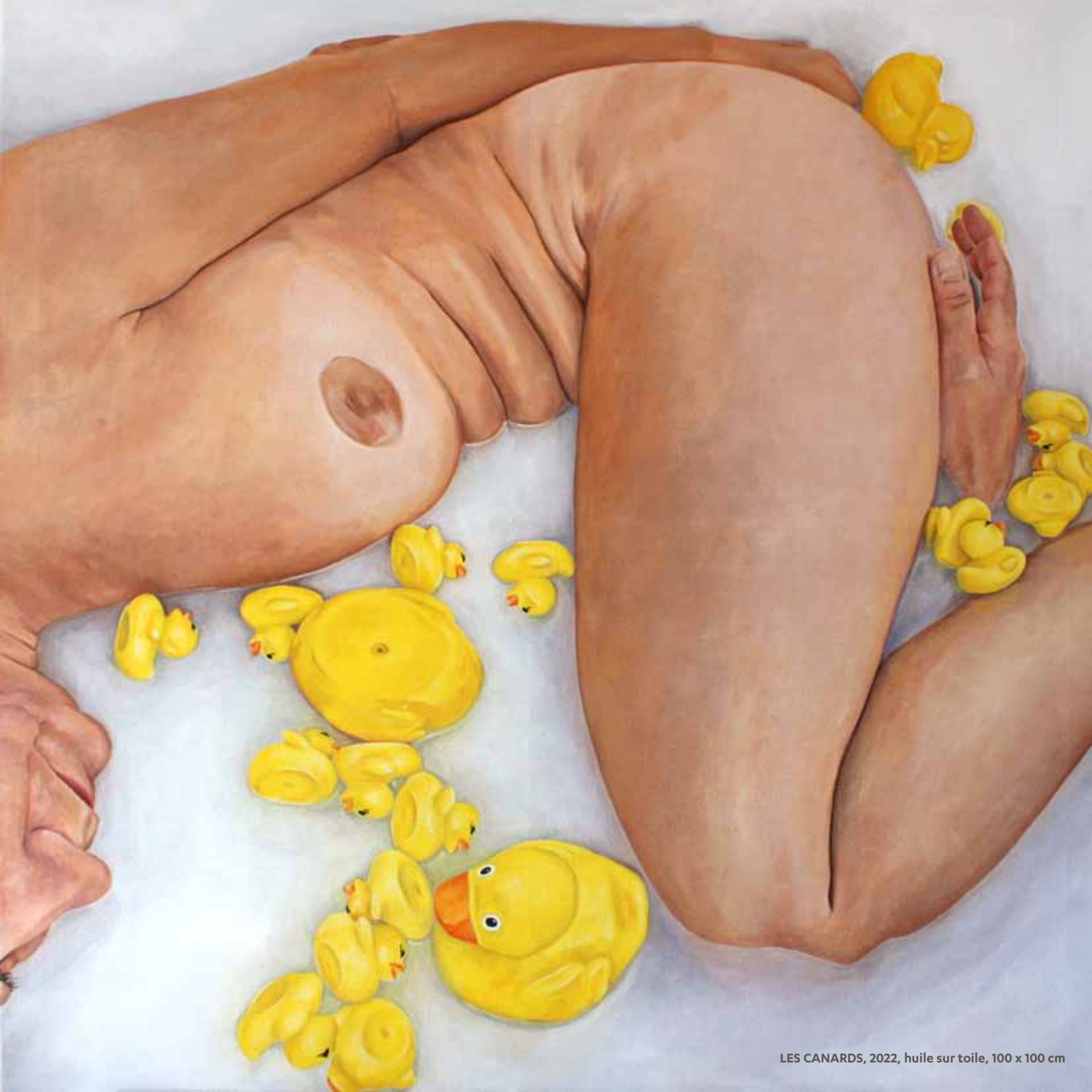
LES CANARDS, 2022, huile sur toile, 100 x 100 cm