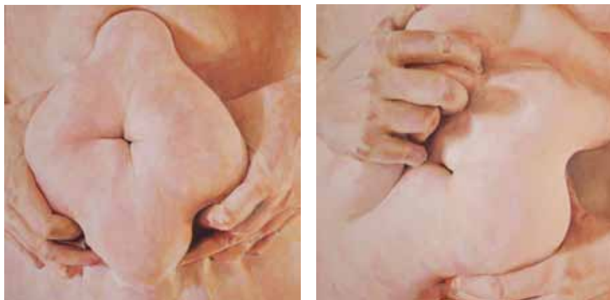
JE T'AIME... MOI NON PLUS I et III, 2009, acrylique sur toile, 50 x 50 cm

Office de la culture du Canton du Jura, 2018