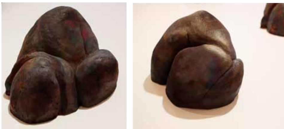
FRAGMENT I et IV, 2016, raku et solution de cuivre mat