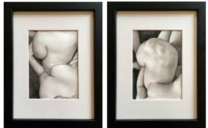
INTIME II ET III, 2015, lavis d'encre de Chine, 27 x 21 cm