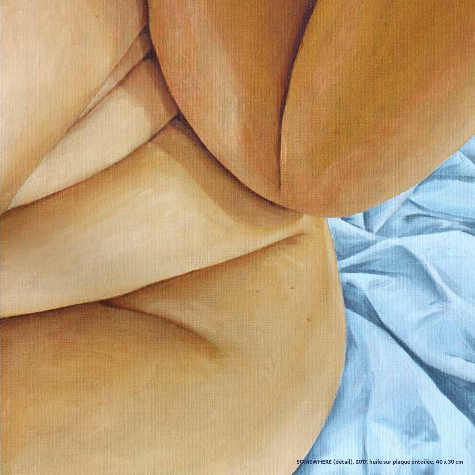
SOMEWHERE (détail), 2017, huile sur plaque entoïlée, 40 x 30 cm