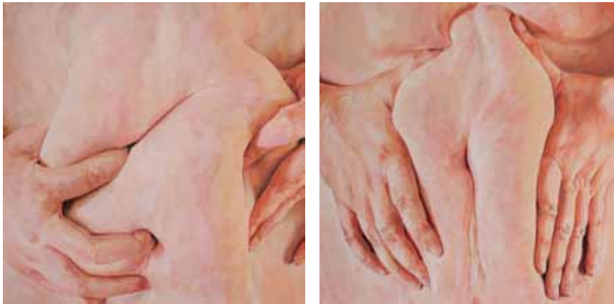
JE T'AIME... MOI NON PLUS II et IV, 2009, acrylique sur toile, 50 x 50 cm

Office de la culture du Canton de Berne, 2013